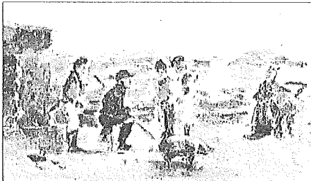
Gallegos gallegos, obra de Picasso realizada en 1895.

Bajo el título Picasso Joven , la Fundación Barrié de la Maza inaugura mañana día 17 una exposición monográfica sobre los primeros años del artista, abarcando desde sus primeras creaciones en Málaga hasta el comienzo de su etapa cubista, en 1906. La muestra, que se podrá ver hasta el 17 de marzo en A Coruña (Cantón Grande, 9), incluye unas 150 obras entre pinturas y dibujos, algunas de ellas nunca expuestas antes.